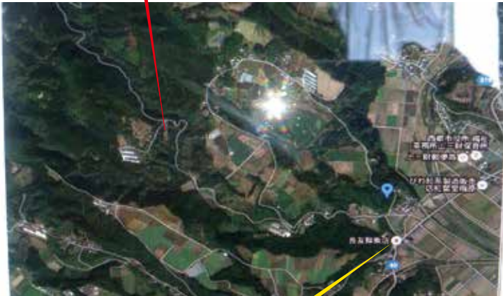
田舎堂・長友鮮魚店

看板のところを左折してください。 右手に田舎地区の公民館があります。 細い坂道をそのまま道なりに進んでください。